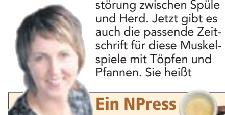
Ein NPress von Andrea Trätner

Kochen ist Männersache. Das sehe ich Kneidlos so, seit mein kleiner Bruder eine Kochlehre gemacht hat. Wenn er allerdings bei uns daheim an einem seiner wenigen freien Tage in der Küche wirbelt, heißt es anschließend meist: Aufräumen ist Frauensache. Wenn Männer kochen, ziehen sie häufig eine Schiene der Zerstörung zwischen Spüle und Herd. Jetzt gibt es auch die passende Zeitschrift für diese Muskelspiele mit Töpfen und Pfannen. Sie heißt