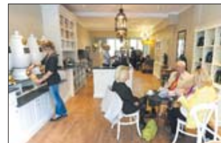
KAFFEE-KULTUR: Machwitz hat in der Karmarschstraße eröffnet.